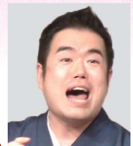
ろまんていぶらうん 浪漫亭不良雲 氏 社会人落語