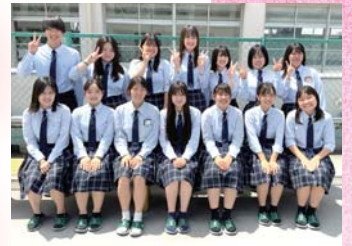
兵庫県立尼崎小田高等学校 看護医療・健康類型の皆さん

日時 令和5年10月21日(土) 午後2時▶午後4時10分(開場/午後1時30分)