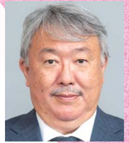
黒瀬 巖 氏 日本医師会常任理事