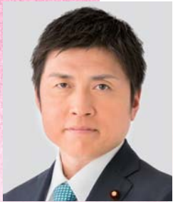
中野 洋昌 氏 衆議院議員